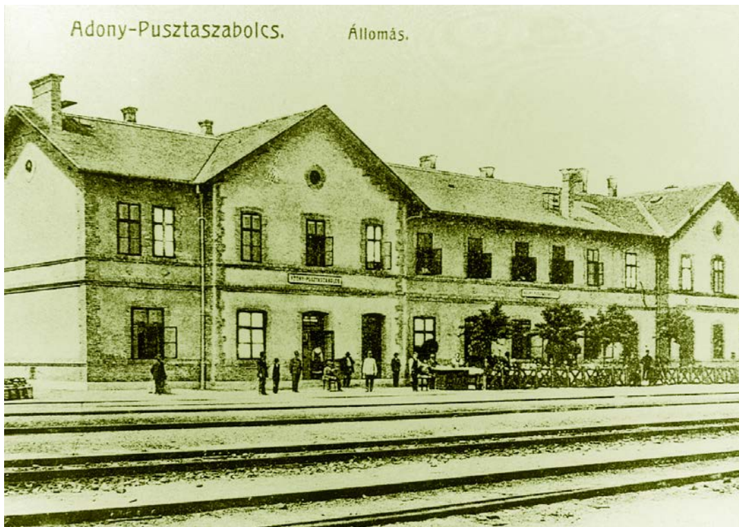
A vasútállomás régen...