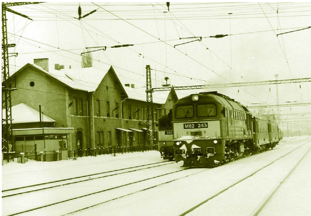
... és a közelmúltban